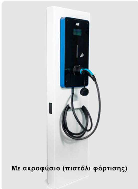
Με ακροφύσιο (πιστόλι φόρτισης)

Τριφασικός επαγγελματικός φορτιστής ηλεκτρικών οχημάτων, με εναλλασσόμενη τάση εξόδου AC.